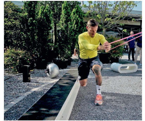
Outdoor-Fitnessgeräte vereinen körperliches Training und Naturerlebnis.

zeit, sondern um komplexe Geräte, die definierte Sicherheitsstandards erfüllen und witterungsbeständig sein müssen.